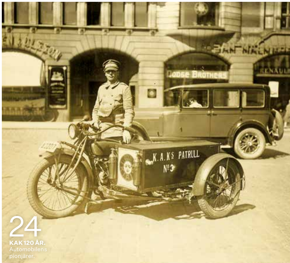
24 KAK 120 ÅR. Automobilens pionjärer.