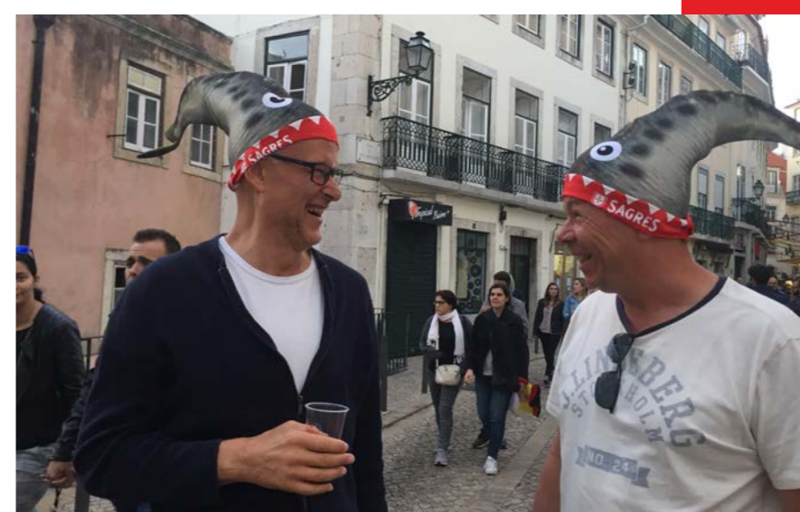
GLADA SARDINER på sardinfestival i Lissabon.

sardinmössor, och vi hade verkligen en trevlig kväll.