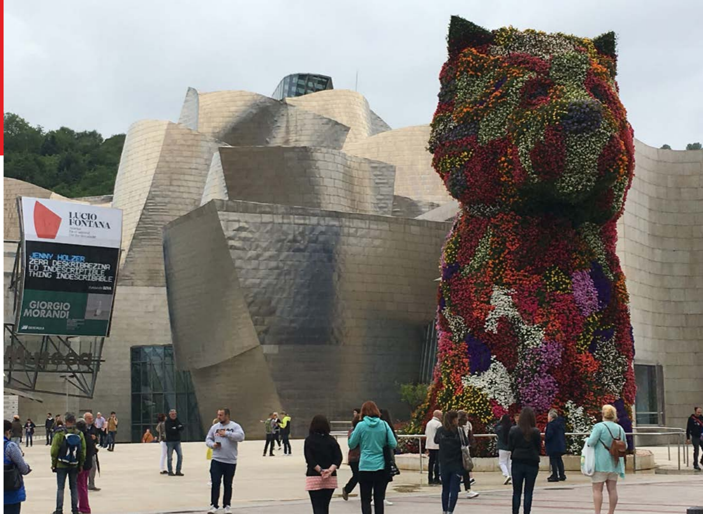
GUGGENHEIM-MUSÉET i Bilbao, med blomsterhunden Puppy av Jeff Koons.

bra restauranger måste bokas långt i förväg. Efter många avslag lyckades vi få ett bord på en nästan omärkt restaurang, en trappa upp i en fd lägenhet, vars avsmakningsmeny smakade mycket bra. Ergo, det blev riktigt bra till slut.