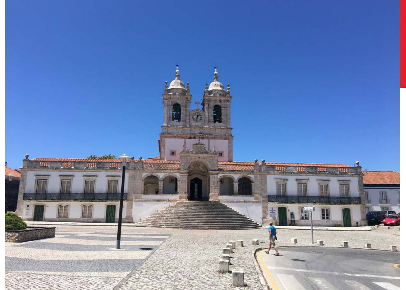
STORA TORGET i Nazare. Hubbe syns till höger.

På vägen mot Lissabon stannade vi i Nazaré, där en kustformation skapar världens högsta vågor, upp till 30 meter höga. En klart trevlig turistfälla med fantastisk utsikt över havet. Efter en god lunch fortsatte vi längs den vackra kustvägen ner till Nadadouro och vidare till våra vänner i Lissabon. Det blev förstas ett hjärtligt välkommande, innan vi begav oss ut på stadens gator där årets Sardinfestival hade startat. Det innebär att varenda driftig portugis drar ut en liten grill för att grilla sardiner, och sälja öl. Vår värd fixade obligatoriska